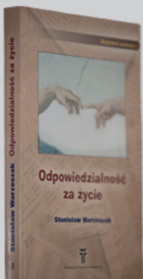
ks. Stanisław Warzeszak ETYKA ODPOWIEDZIALNOŚCI ZA ŻYCIE Warszawa 2003