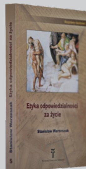
ks. Stanisław Warzeszak ETYKA ODPOWIEDZIALNOŚCI ZA ŻYCIE Warszawa 2008

P APIESKI WYDZIAŁ TEOLOGICZNY W WARSZAWIE WYDAJE SWOJE PUBLIKACJE W 3 SERIACH: WARSZAWSKIE STUDIA TEOLOGICZNE – ROZPRAWY NAUKOWE (8 TOMÓW), PODRĘCZNIKI (8 TOMÓW) ORAZ POMOCE NAUKOWE (2 TOMY).